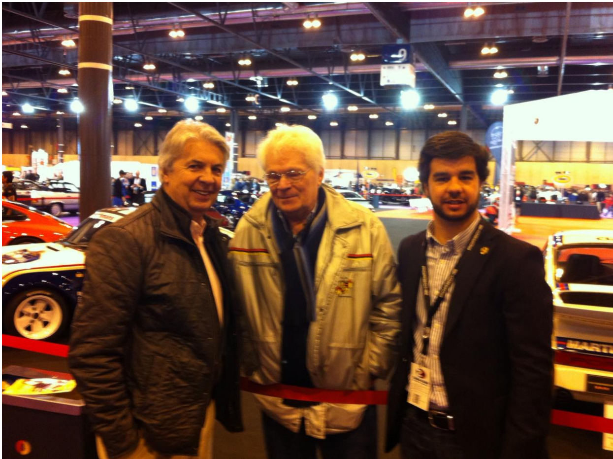
Tres presidentes del Club Porsche